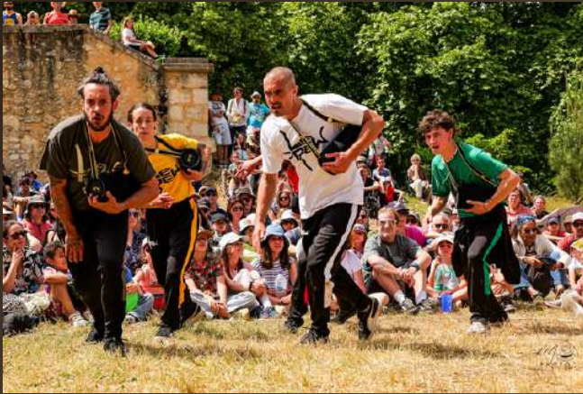
Carré-Colonnes – Festival Échappée Belle