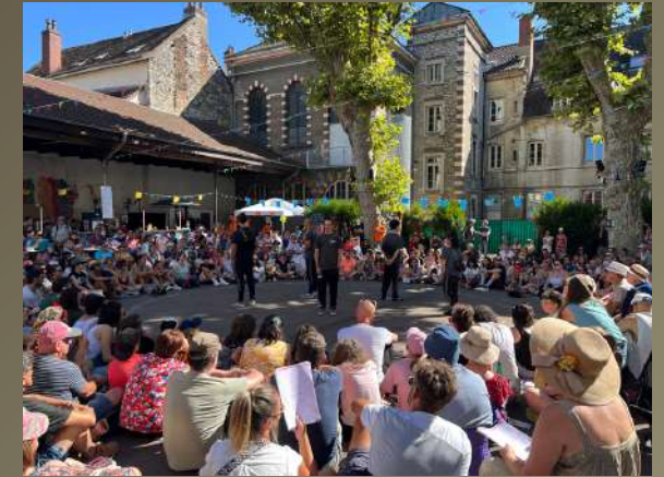
Chalon – Festival Chalon dans la Rue

Le Crew est un spectacle qui se joue dans tous les environnements : dans l'espace public (parc, rue, cour d'école, halle couverte...), ainsi qu'en intérieur (grande scène, salle des fêtes, gymnase...). Le Crew se joue de nuit comme de jour.