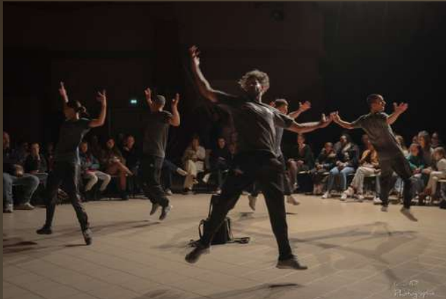
Parempuyre (en salle)