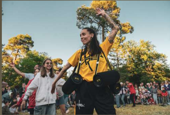
Carré-Colonnes – Festival Échappée Belle