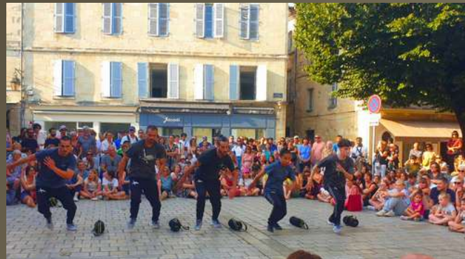
Périgueux – Festival Mimos