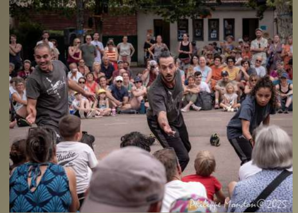
Chalon – Festival Chalon dans la Rue